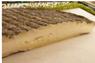
Saint Nectaire fermier AOP