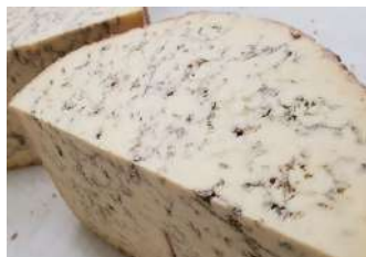
Stilton AOP au Porto