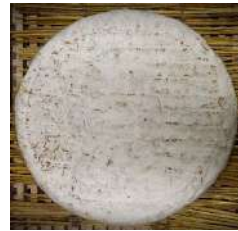
Brie de Melun AOP