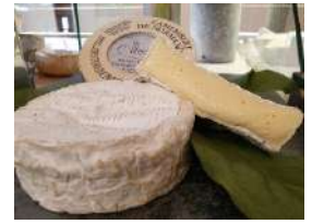
Camembert JORT AOP