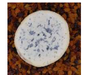
Fourme d'Ambert AOP