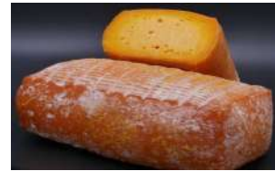
Brique des Flandres