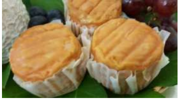
Trou du cru