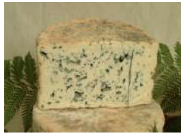
Bleu d'Auvergne AOP