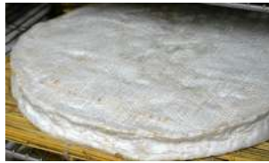
Brie de Meaux AOP