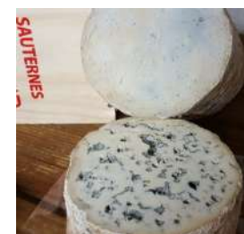
Fourme AOP Sauternes