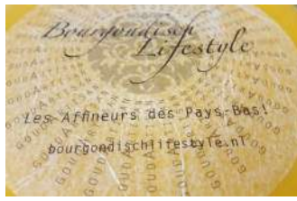
Gouda tendre fermier