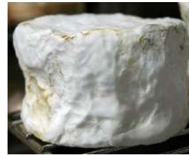
Chaurce fermier AOP