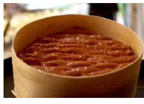
Affidélice affiné au Chablis