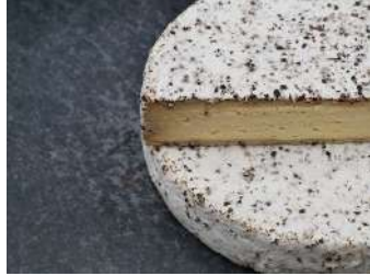
Valbrie / Brie au poivre