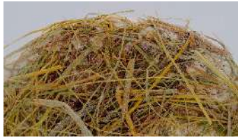
Tomme de Savoie au foin