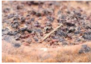
Tomme au marc de raisins