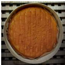
Epoisses marc Bourgogne AOP