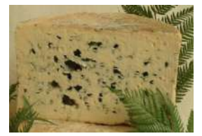
Bleu des Causses AOP