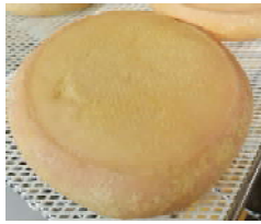
Abbaye de Cîteaux