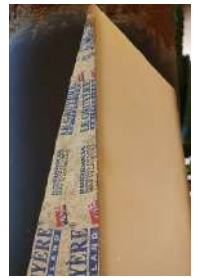
Gruyère d'alpage vieux AOP