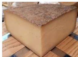
Condio alle erbe