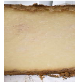
Salers vieux AOP