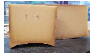
Beaufort alpage +18mois AOP