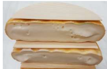
Reblochon de Savoie AOP