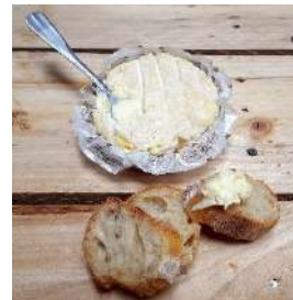
Tentation de St Félicien