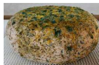
Délice des Hauts Fleurs