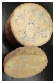
Fourme de Montbrison AOP