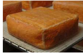
Maroilles fermier AOP