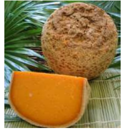
Mimolette extra vieille