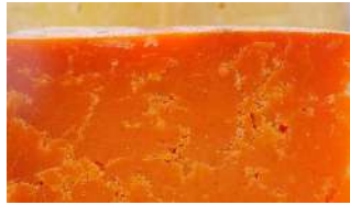
Leicestershire Red Cheddar