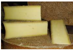
Abondance fermière AOP