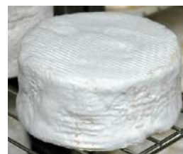
Royal Briard / Brillat Savarin