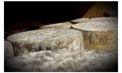
Tomme de Savoie IGP