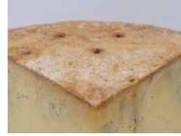
Bleu de Termignon alpage