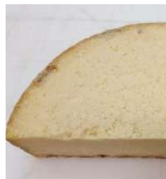
Salers entredeux AOP