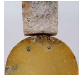
Cheddar toilé fermier AOP