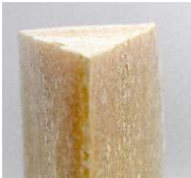
Parmigiano Reggiano +67 mois AOP