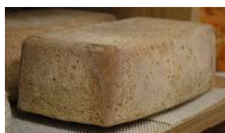
Galette de Morsled