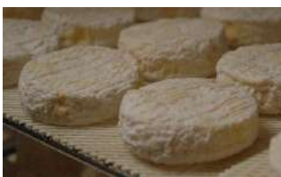
Saint Marcellin AOP