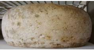
Bethmale des Pyrénées