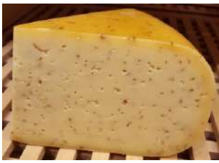
Gouda cumin fermier