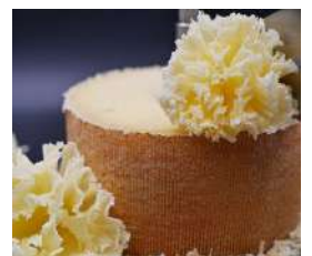
Tête de Moine AOP