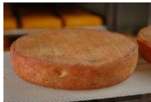
Munster fermier AOP