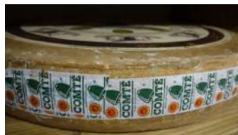
Comté du Jura AOP 18 ou 30 mois