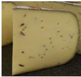
Gouda fermier truffes