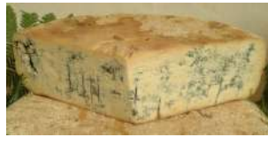
Bleu de Gex AOP