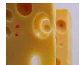
Emmental de Savoie IGP