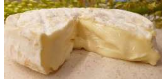
Saint Félicien AOP